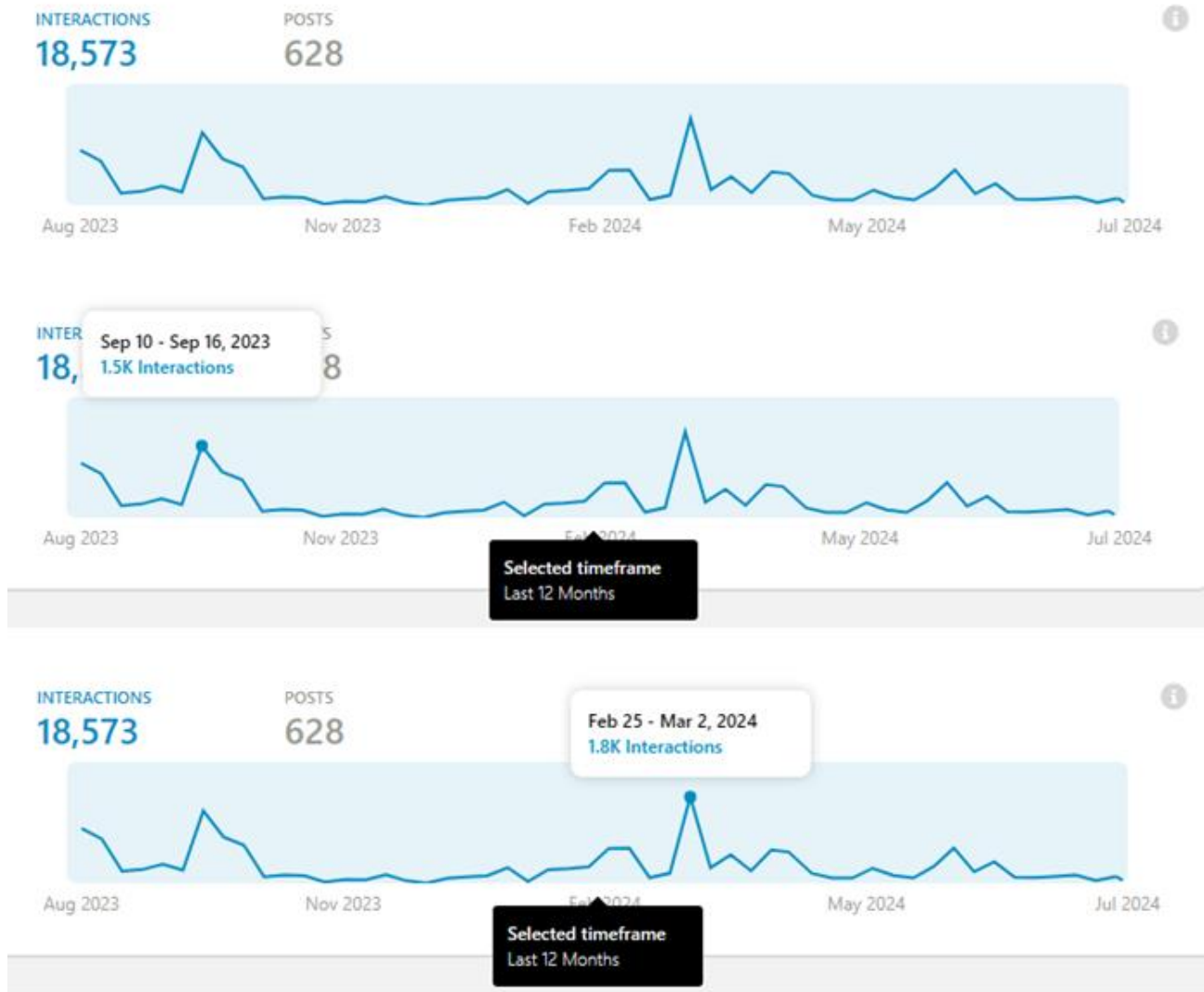
Рисунок 1. Динаміка охоплення російськомовних дописів про ситуацію у Польщі, де піднімалося питання українських біженців

Специфіка подання новин. Найбільш активними акаунтами російських ЗМІ є «Новости Первого канала», «ІноСМИ», «РБК», «РИА Новости». Якщо «Новости Первого канала» спеціалізується на фрагментах відео, підписами до них та власним перекладом спікерів, то «ІноСМИ» видають головний меседж з посиланням на назви закордонних медіа, звідки було взято інформацію. Проте, у більшості самих посилань на першоджерело немає, а самі видання, до яких апелює «ІноСМИ» просувають наративи на захист російської політики війни в Україні. Наприклад, інтернет видання Steigan.no на яке посилаються «ІноСМИ», позиціонується як норвежське видання. 16 лютого 2023 р. воно друкує статтю шведського дослідника Оли Тунадер під назвою «Наш шлях до ядерної війни» [25]. У статті автор надає можливий сценарій того, як війна Росії проти України може перетворитися на ядерну війну. Він говорить про силове захоплення влади в Україні у 2014 р., ініціативу Києва почати війну проти Криму та Донбасу та необхідність втручання Росії у цю війну. Втручання США перетворює їх на маргіналізовану державу, яка вже не здатна бути надійним гарантом безпеки у Європі, що може призвести до ядерної катастрофи. Важливо те, що сам автор Ола Тунадер, є представником так званої міжнародної асоціації «Друзі Криму», що створена російськими урядовими структурами ще у 2017 р. І за даними «Центру журналістських розслідувань» він є агентом впливу Кремля [20].